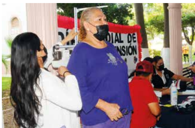
LA DIABETES: una pandemia global que va en aumento