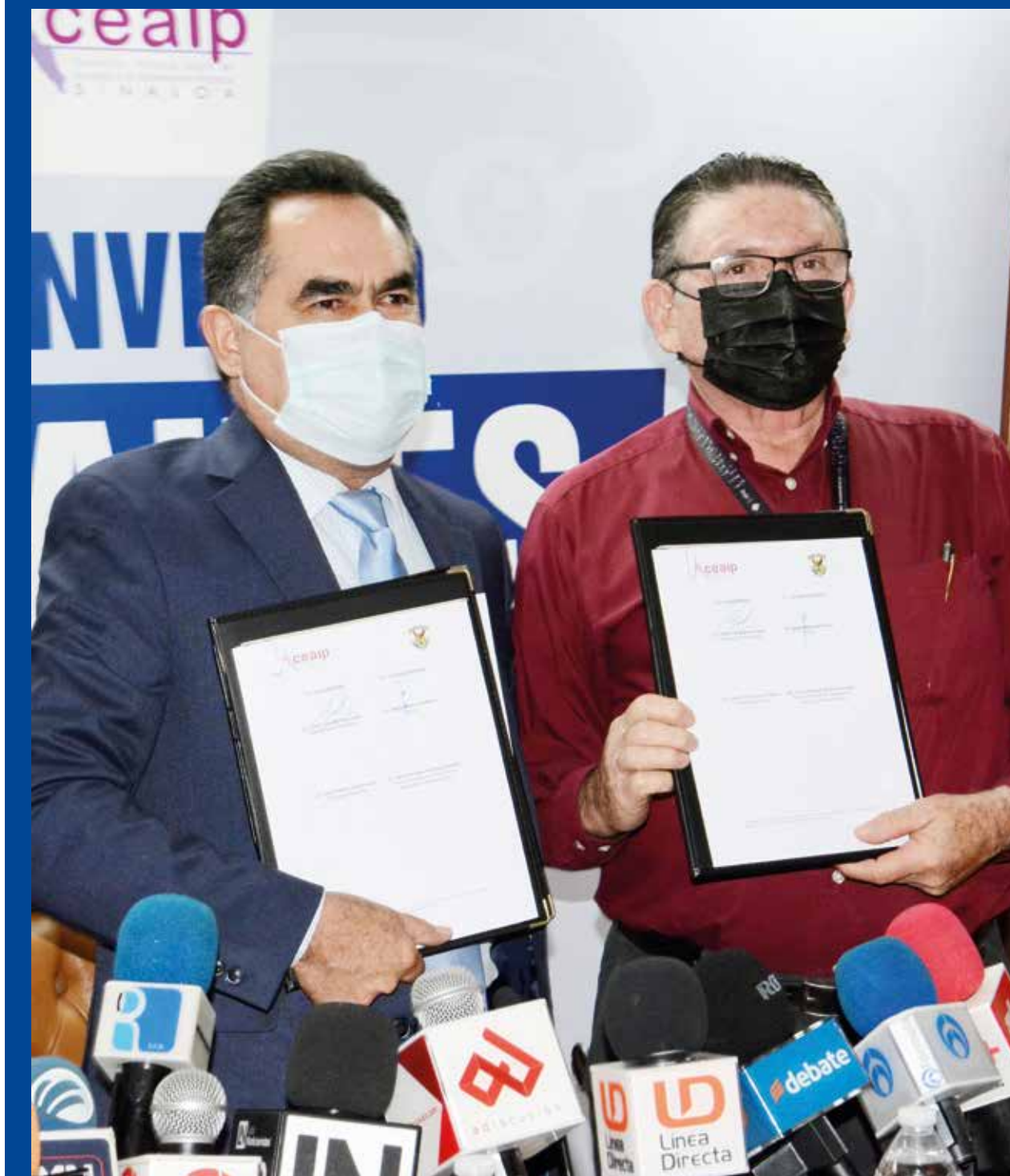
LA UAS Y LA CEAIP FIRMAN CONVENIO DE COLABORACIÓN