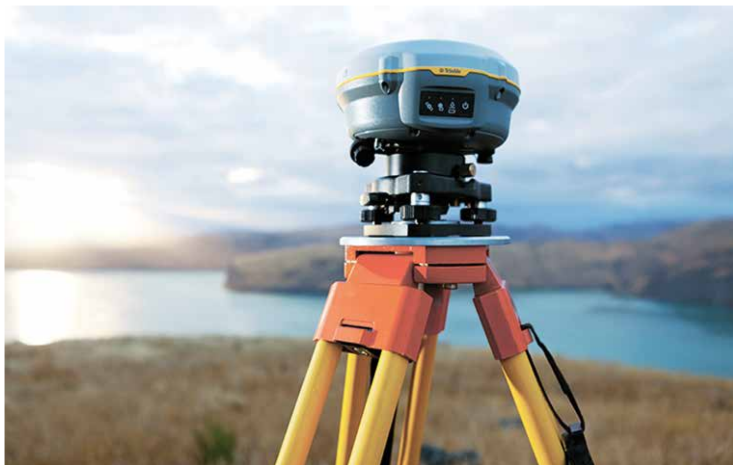
Figura 1. Receptor de GNSS de orden geodésico.

Para la solución de problemas (de investigación y de ingeniería aplicada) propios de la Geodesia y Geomática, se requiere una alta precisión en la ubicación de puntos sobre la superficie terrestre, considerando que la correcta interpretación y análisis dependen de la precisión obtenida. Sin embargo, cualquiera de los receptores utilizados (orden geodésico o bajo costo), el resultado depende del tipo de procesamiento de las observaciones, tratamiento de la información y