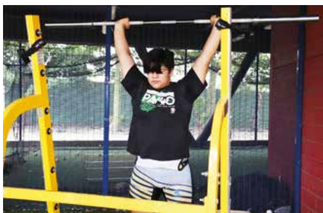
Águilas UAS con LOGRO HISTÓRICO EN HALTEROFILIA