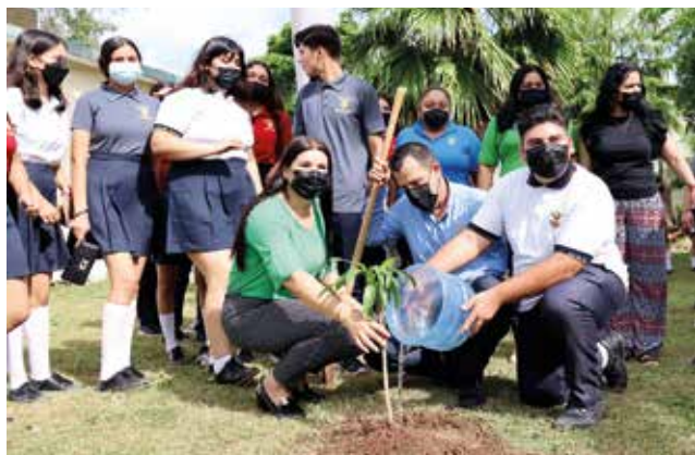
Participan en jornada de PLANTACIÓN DE ÁRBOLES